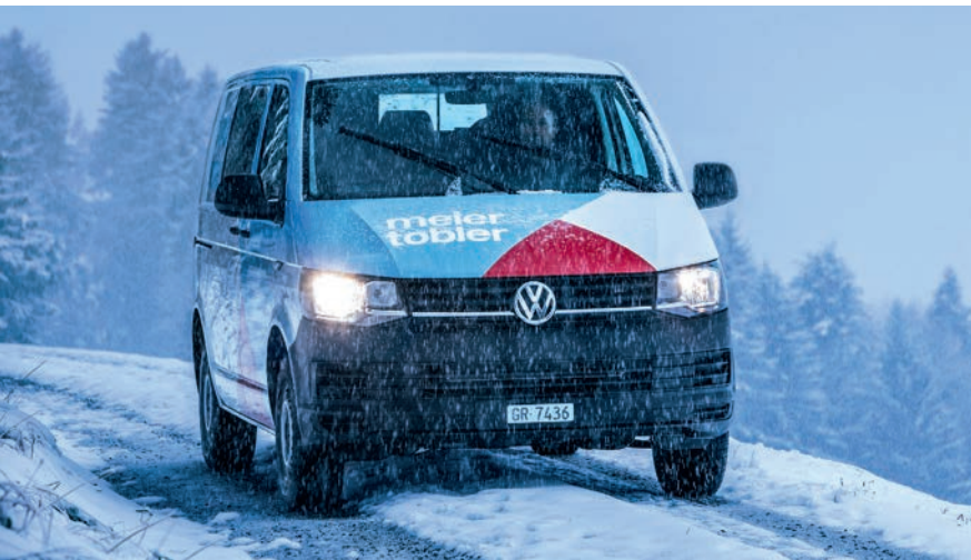
Das Meier-Tobler-Service-Mobil, bei jedem Wetter einsatzbereit.