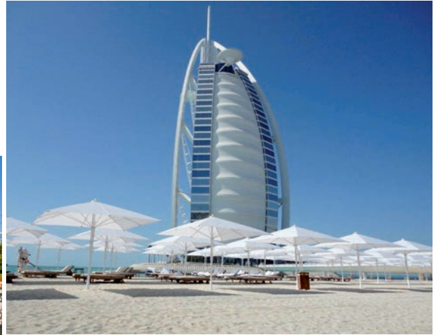
Diese weißen „Riesenschirme“ bleiben auch bei Windstärken bis 145 km/h sicher stehen

Sonnenschirme der Bahama GmbH aus Reichshof sind für Hoteliers und Gastronomen weltweit ein echter Erfolgsfaktor. In ihnen stecken viel Kreativität und umfassendes Konstruktionswissen. Seit die Konstrukteure mit Autodesk Inventor und Visualisierungstools von Autodesk arbeiten, kann das Unternehmen seine Rolle als aktiver Partner bei Hotel-, Restaurant- und Schiffsbauprojekten noch besser wahrnehmen. MuM ist bei Fragen mit guten Lösungen und neuen Ideen zur Stelle.